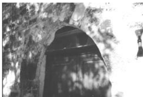
Portale medievale, oggi bottega artigiana

V. Fossatello (trav C.so Vittorio Emanuele II)