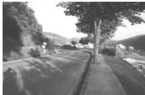
Suggestivo scorcio del viale che conduce ai Bagni

V. Martiri della Libertà (da V.Garibaldi a V.Septempedana) Già V.Bagni e V.Collecchie