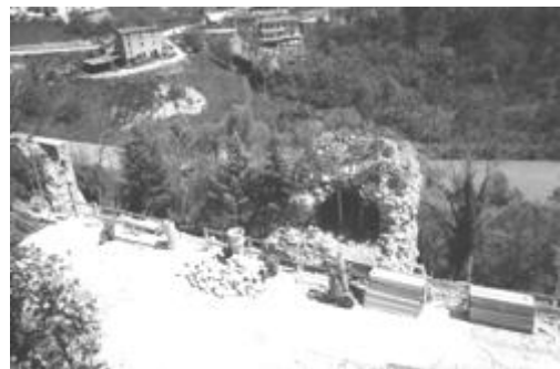
Ruderi delle mura medievali nella zona ove si apriva la Porta Santa Croce, di cui si è perduta ogni traccia

V. Le Mura (da P.za Matteotti a via S.Giovanni)