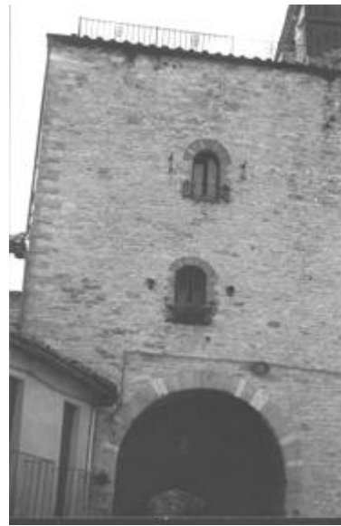
Torre Porta Vecchia

L.go Blasi Vincenzo (da Porta Vecchia a C.so Vittorio Emanuele II)