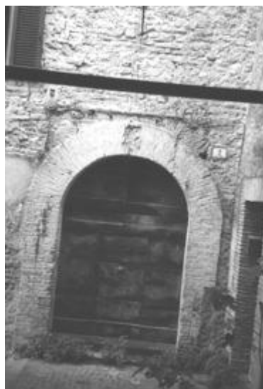
Porta della ex scuola elementare comunale

V. Camilli Annibale (trav. C.so Vittorio Emanuele II)