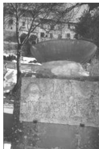
Il cippo posto nel 1934 a ricordo dei caduti della prima guerra mondiale nel viale della rimembranza

Già v.le della Rimembranza e v. dei Cappuccini