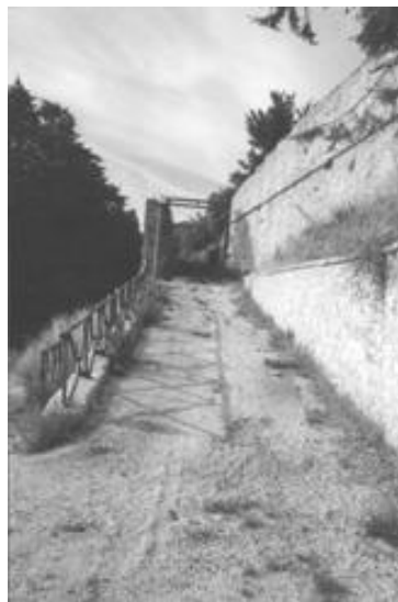
Il tracciato della medievale Porta S.Martino

V. S. Martino (da P.za S.Filippo a Porta S.Martino)