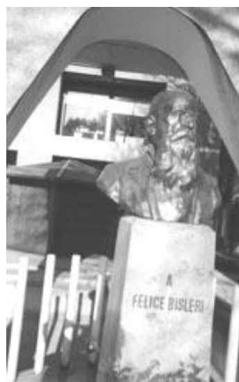
Monumento a Felice Bisleri

L.go Bisleri Felice (da V.Flaminia a P.za Umberto I)