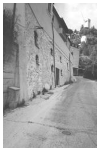
Scorcio di Nocera: sullo sfondo il "Campanaccio", la Palombara e l'ex Mulino

V.Case (le) (da V. Bonacci Brumanonti a V.Flaminia)