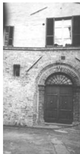
Porta di ingresso della ex Caserma Carabinieri

V. Pontani Tullio (da C.so Vittorio Emanuele II a P.za Caprera) Già Borgo Piccolo