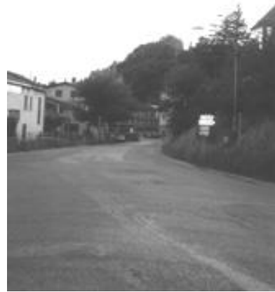
Inizio di Via Garibaldi

V. Garibaldi Giuseppe (da V.Flaminia a V. Maestà del Picchio)