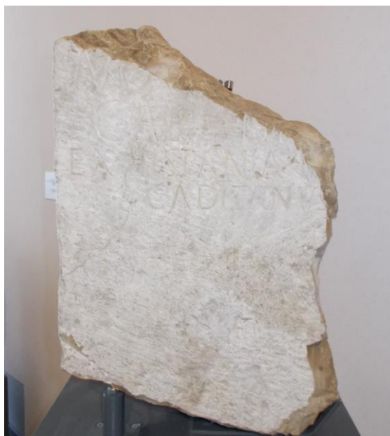
Epigrafe Gaditanus , Maestà del Picchio