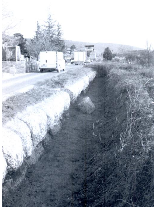
La Flaminia nei pressi di Colle