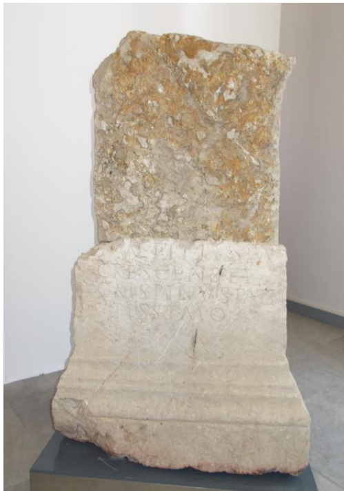
Cippo sepolcrale Case