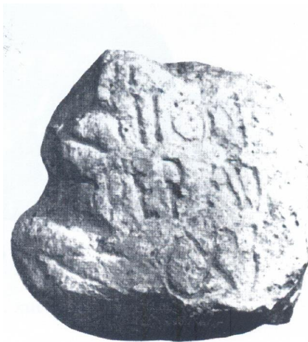
Milario, Fonte del Coppo