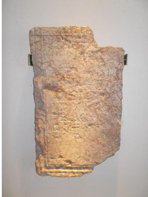
Epigrafe Via Garibaldi